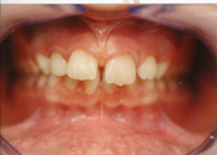
Esempio di morso aperto