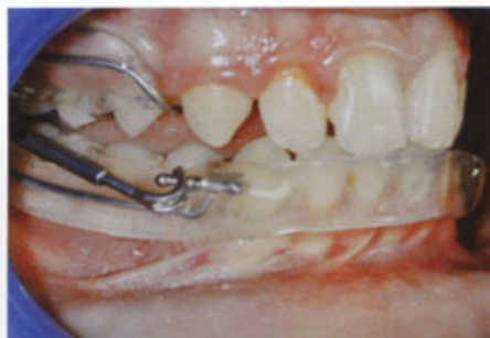
PUL inserito in bocca