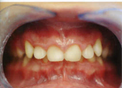
Esempio di morso chiuso