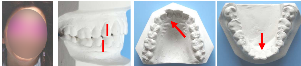
Patiente de 35 ans : récurrence d'un traitement orthodontique. Bi-endoalvéolie maxillo-mandibulaire, malpositions et bruxisme. La demande est esthétique et fonctionnelle : Proposition de PUL multi-fonctions pour harmoniser les maxillaires.