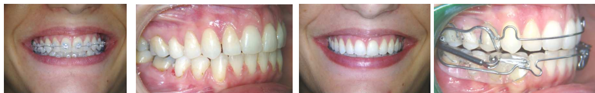
Après 6 mois de PUL, finition par multiattache basse friction esthétique de 6 mois, maintien de la largeur du sourire. Pose d'une contention nocturne 4 D (arcs linguaux collés + PUL anti-récurrence).

Indications du PUL multifonctions chez l'Adulte : Petite correction dento-alvéolaire sagittale, transversale et fonctionnelle. Expansion maxillaire, expansion mandibulaire, distalisation latérale supérieure par ancrage mandibulaire, redressement des incisives inférieures, neutralisation des muscles masticateurs (traitement du bruxisme), amélioration de la respiration nocturne, préservation de l'ATM qui reste fonctionnelle grâce aux ressorts mandibulaires.